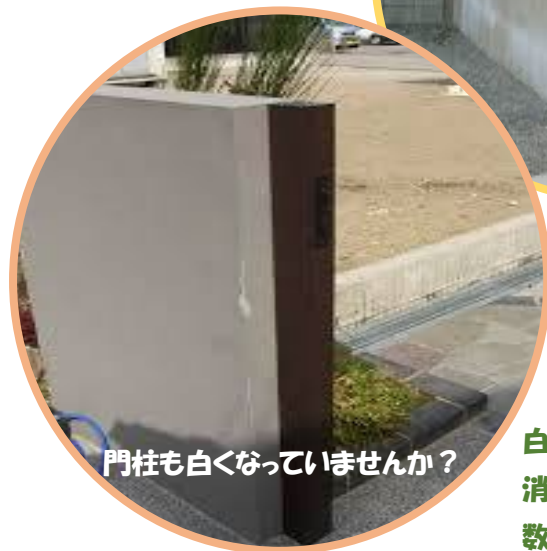
門柱も白くなっていませんか？