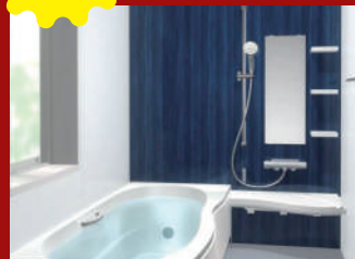
LIXIL UB アライズZ