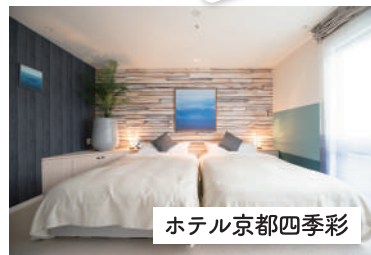
ホテル京都四季彩